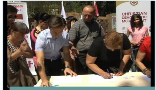
ქდმ-ს აქცია “არა - ერთსქესიან ქორწინებას”