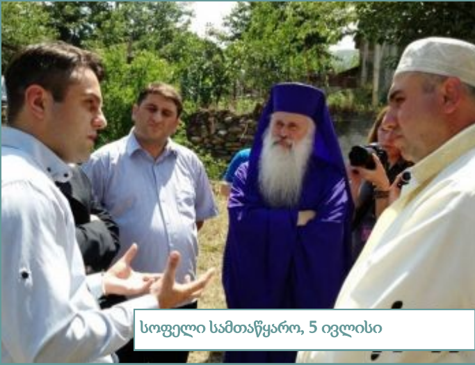
სოფელი სამთაწყარო, 5 ივლისი

იმედი აქცენტს აკეთებს იმ გარემოებაზე, რომ პარასკევის ლოცვამ სამთაწყაროში ინციდენტების გარეშე ჩაიარა და ადილზე ხელისუფლების, დიპლომატიური კორპუსის წარმომადგენლები და უფლებადამცველები იმყოფებოდნენ.